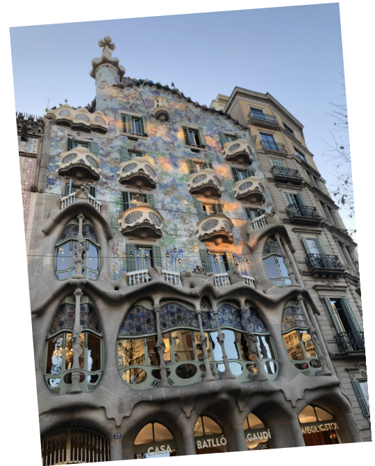
La casa Batlló estilo art nouveau