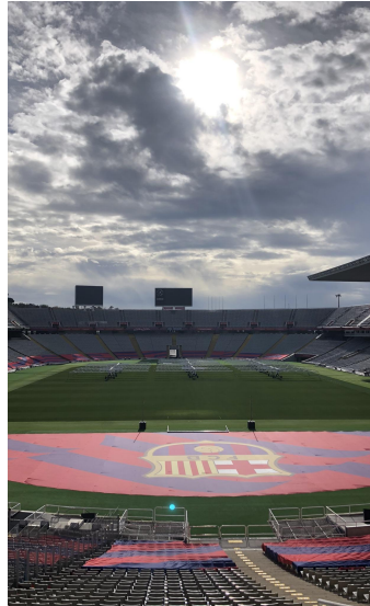
Estadio Olímpico Lluís Companys