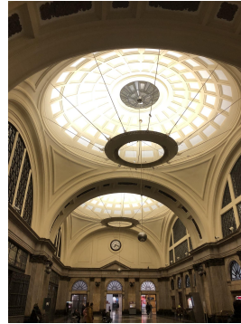
Estació de França