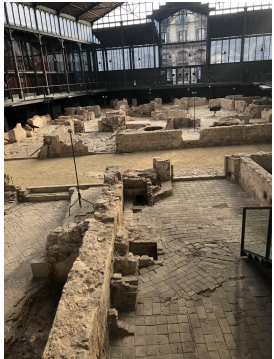
Restos romanos en Barcelona