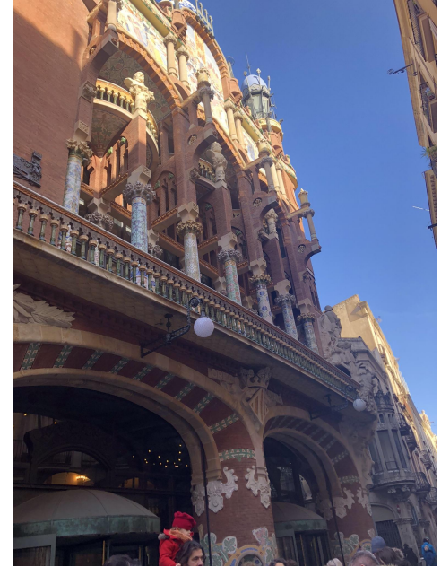
palau de la musica