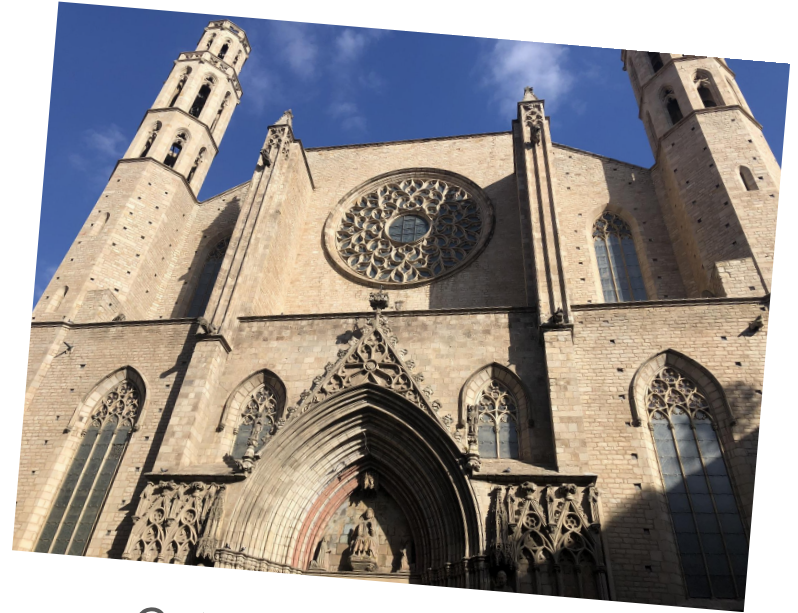
Catedral del mar

Hay un libro muy famoso que se llama la Catedral del mar