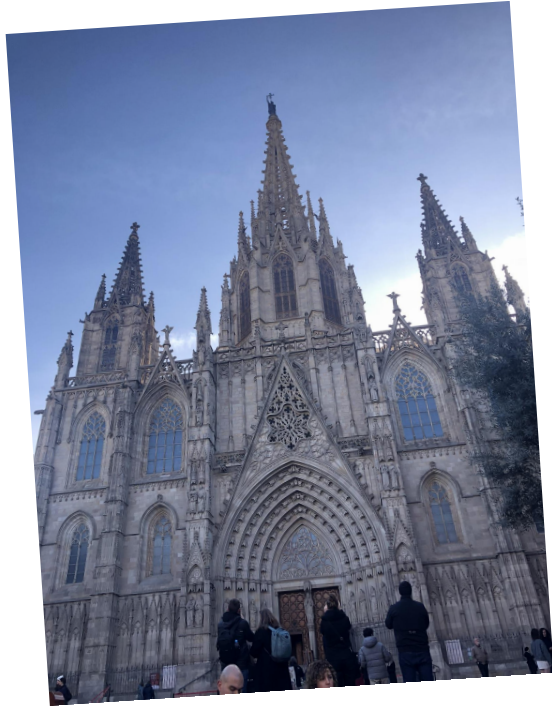
Catedral Santa Eulalia