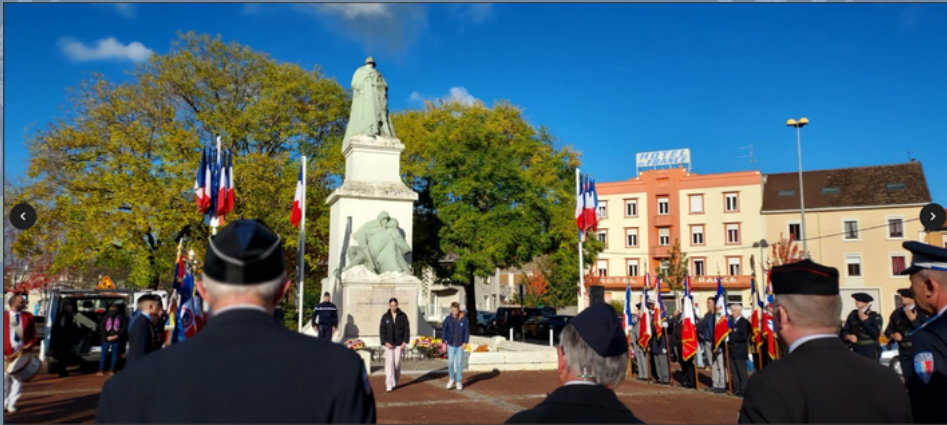
PHOTO DE "PRESQUE GROUPE": UNE PENSÉE POUR LES ABSENTS ET POUR MME GUILLAUD, QUI PREND LA PHOTO!