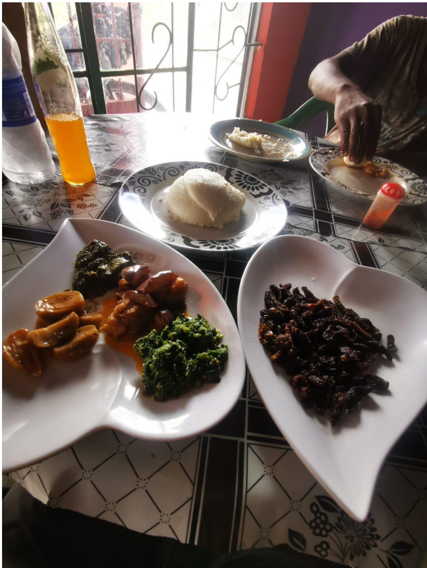
« Dernier repas en Zambie. De l'ugali, des chenilles grillées, des légumes et de la viande. Globalement, j'aurai mangé la plupart du temps ce type de repas ici. »