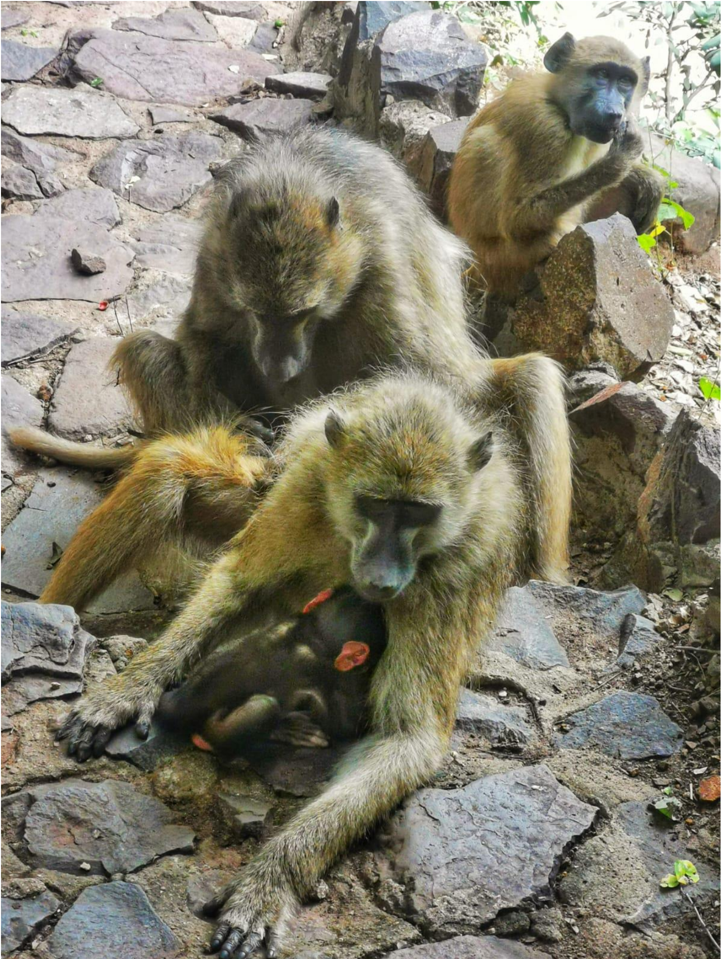
« La faune locale ! »