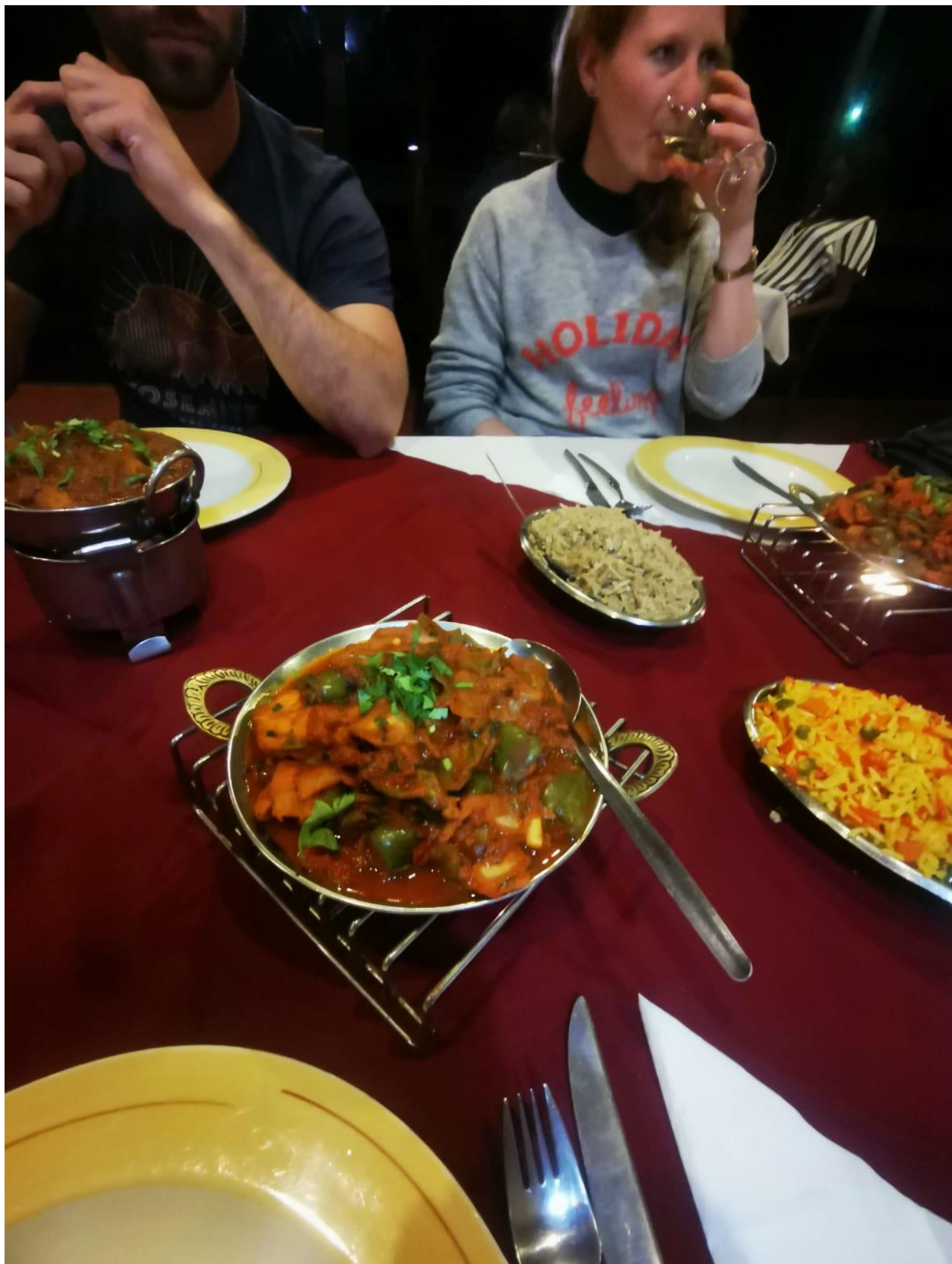
« Quelques copains venant du monde entier rencontrés à l'auberge de jeunesse, de très bons moments passés ici avec eux notamment ! »