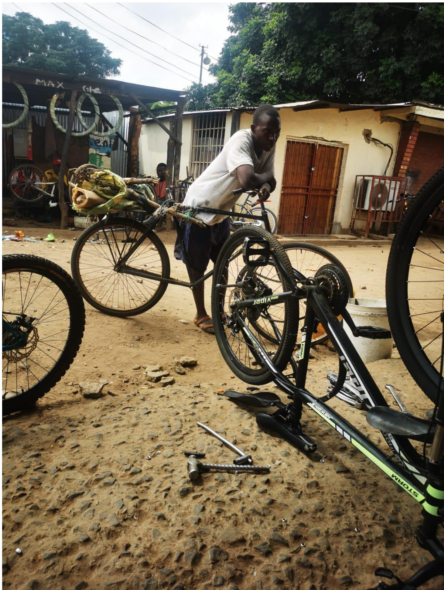
« Arrivée à Livingstone, premier stop : réparer ma jante ! »