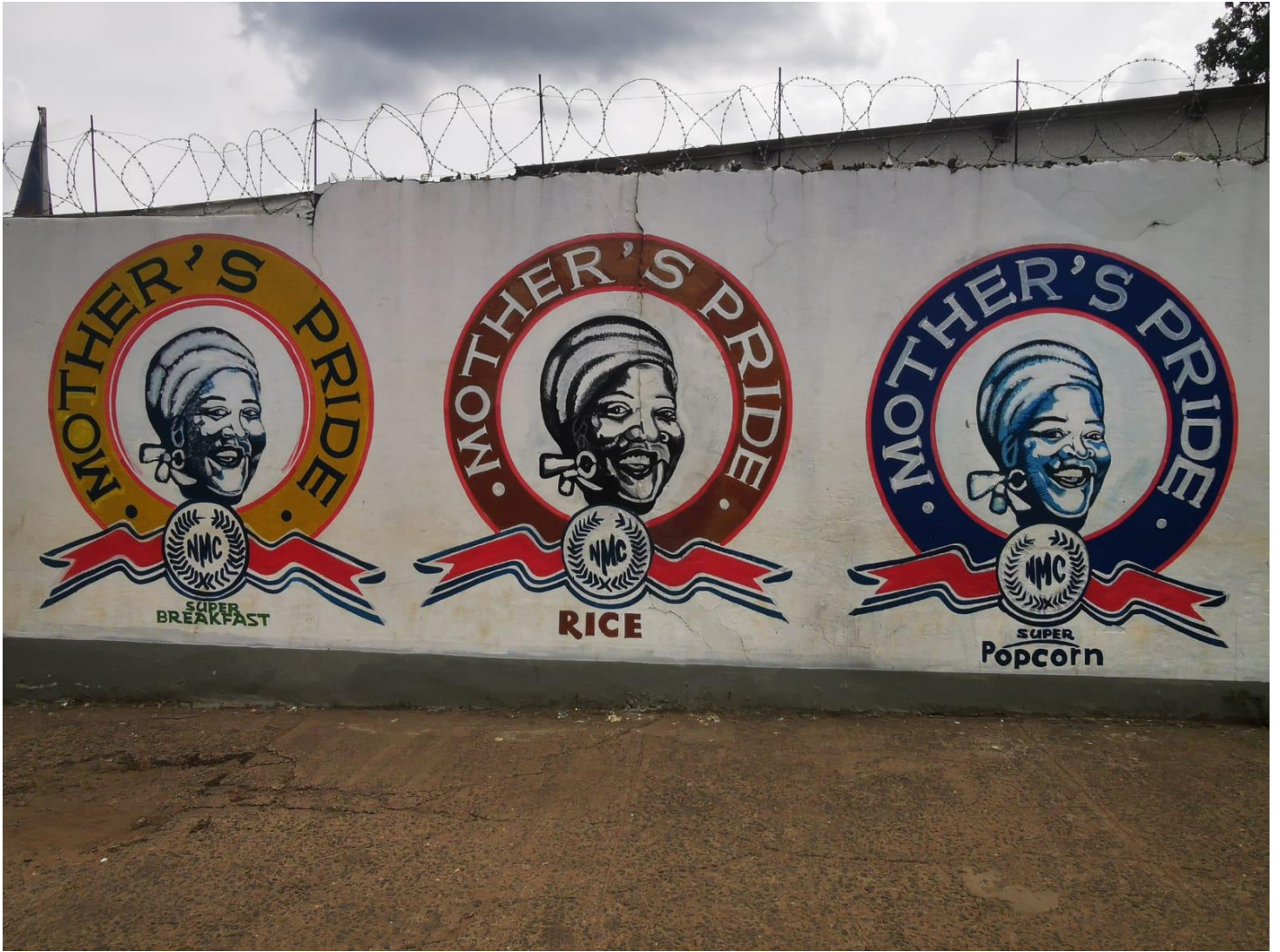
« Livingstone »