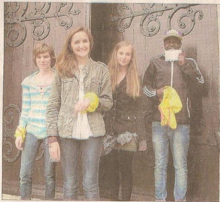
Premier point d'arrêt obligatoire : l'église. Les jeunes y récupèrent une lettre leur indiquant leur prochaine halte.