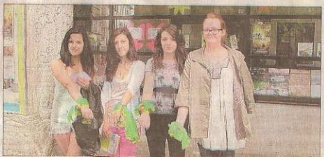
Après leur passage à l'office de tourisme, les groupes retournent au collège pour tenter de trouver le trésor.