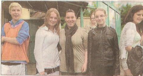
Le stade municipal faisait partie des points d'arrêt de l'aventure. Pour recevoir le précieux indice, les adolescents devaient effectuer un tour de terrain.