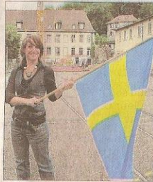
14 heures : le départ de la chasse au trésor est donné.

Le but de l'aventure : faire découvrir aux 4 e et 3 e venus du collège de Karlstad, le patrimoine et les sites symboliques de La Tour-du-Pin. L'occasion également de conclure de manière ludique leur séjour dans la sous-préfecture nature, au cours duquel ils ont visité Lyon et les grottes de Choranche. Aujourd'hui, le groupe rentre en Suède... Des souvenirs plein la tête. □